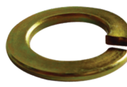
แหวนสปริงชุบซิงค์สีรุ้ง (Yellow Zinc Plated)