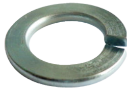
แหวนสปริงชุบซิงค์สีขาว (White Zinc Plated)