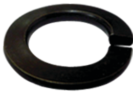
แหวนสปริงชุบดำ (Black Oxide)