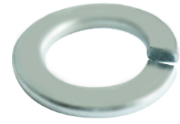
แหวนสปริงชุบ HDG (Hot Dip Galvanized)

ผลิตจากเหล็กเกรด A มีการชุบเคลือบผิว 4 แบบให้เลือกใช้ตามความเหมาะสม